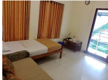
Single THUSHARA Type 2 (petite chambre, environ 12 m 2 , 1 lit simple, confort sommaire), plus récente, plus grande et plus lumineuse que les Single Thushara, située au 1 er étage ( en nombre très limité (4) )