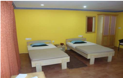
Twin Cottage (confort très sommaire, équipée de 2 lits simples, chambre située dans la palmeraie), en nombre très limité (2)

Nouveauté 2025 ! Les Roots room (équipées de 2 lits simples) sont des nouvelles chambres situées à proximité du bloc des Economy Rooms, elles sont plus petites que les Economy Rooms. Elles sont traversantes, entourées de nature et chacune dispose d'une terrasse. Parfaite pour une personne seule, à partager, il faut bien se connaître.