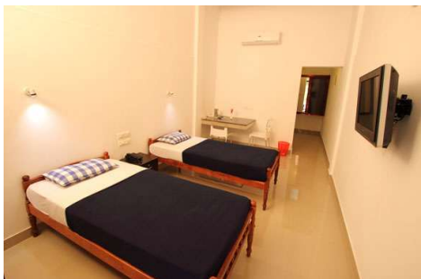
Economy room (14)