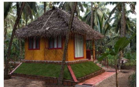
Bamboo Hut (2) situés dans la palmeraie