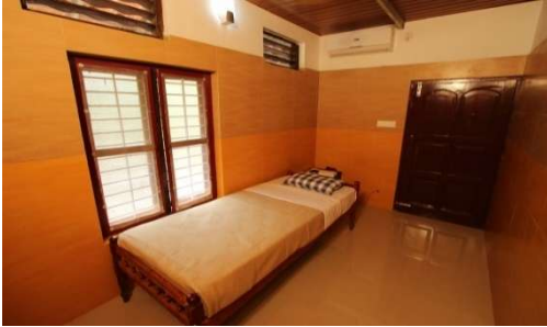
Single THUSHARA (très petite chambre, environ 9m 2 1 lit simple, en confort très sommaire), en nombre très limité (3)